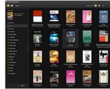
Adobe Digital Edition